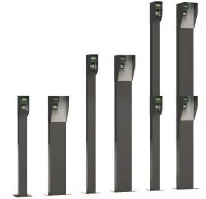
Pelare med regnskydd och monterad scanner.