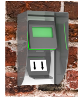
Scanner med regnskydd monterad på tegelvägg